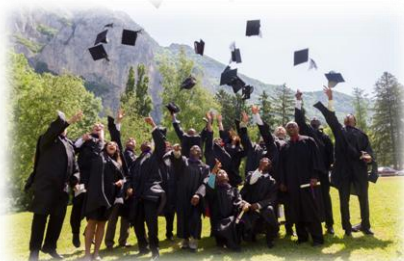
Les lauréats ont lancé leurs toques pour marquer la fin d'une étape