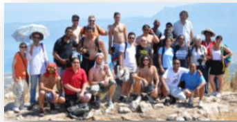
Les étudiants à l'emplacement du temple d'Aphrodite sur l'Acrocorinthe

Les sites visités : le rocher de l'Aréopage et l'Acropole à Athènes, Delphes, le Canal de Corinthe, l'Ancienne Corinthe et l'Acrocorinthe, Isthme, Cenchrées, l'Héraion de Pérachora, Mycènes, Nauplie, Epidaure. Bravo pour l'initiative et à l'année prochaine !