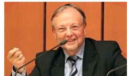
Professeur Armand ABECASSIS

une conférence unique dans le cadre du Bert Beverly Beach Lectureship Lecture juive des évangiles dimanche 28 septembre 2014 à 16 h à l'Aula du Campus