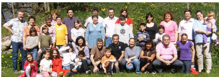
Les participants au week-end