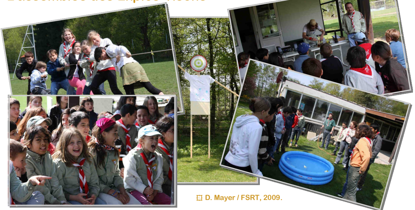
📷 D. Mayer / FSRT, 2009.