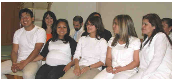
Les nouveaux membres de la famille.

📅 Eglise de Genève d'expression espagnole, 2009.